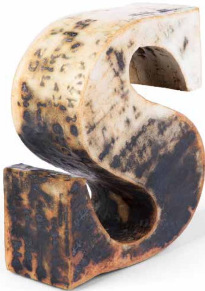
S-type | CLAY | CERÁMICA | 12x11x4,5 cm