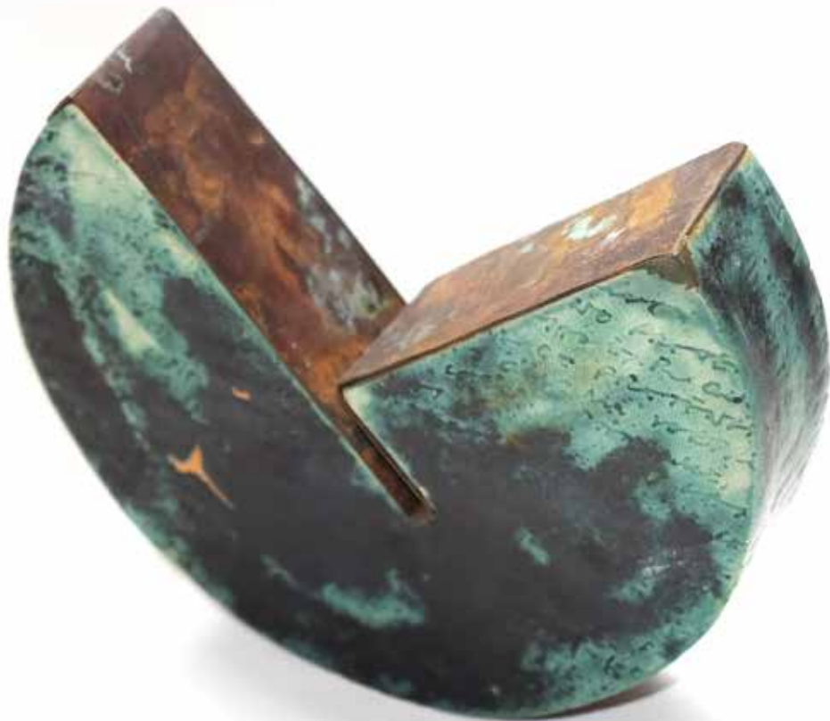
G. CIRCLES SERIES | CLAY+COPPER | CERÁMICA+COBRE | 14x17x4 cm