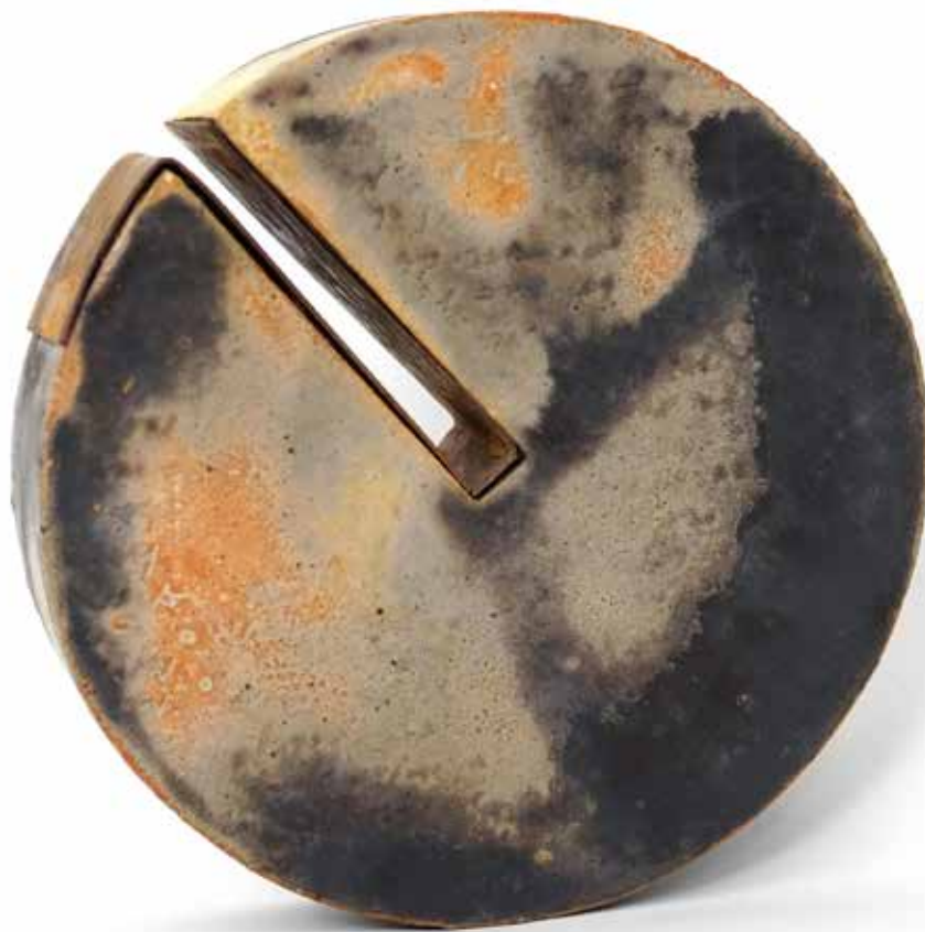
C. CIRCLES SERIES | CLAY+COPPER | CERÁMICA+COBRE | 17x17x4 cm