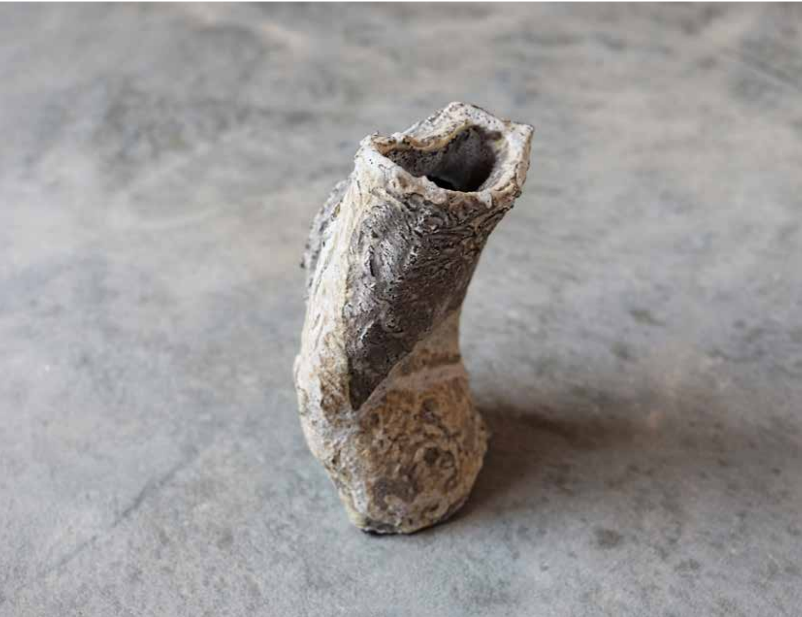
KINKY | BLACK CLAY | CERÁMICA NEGRA | 8x16x10 cm