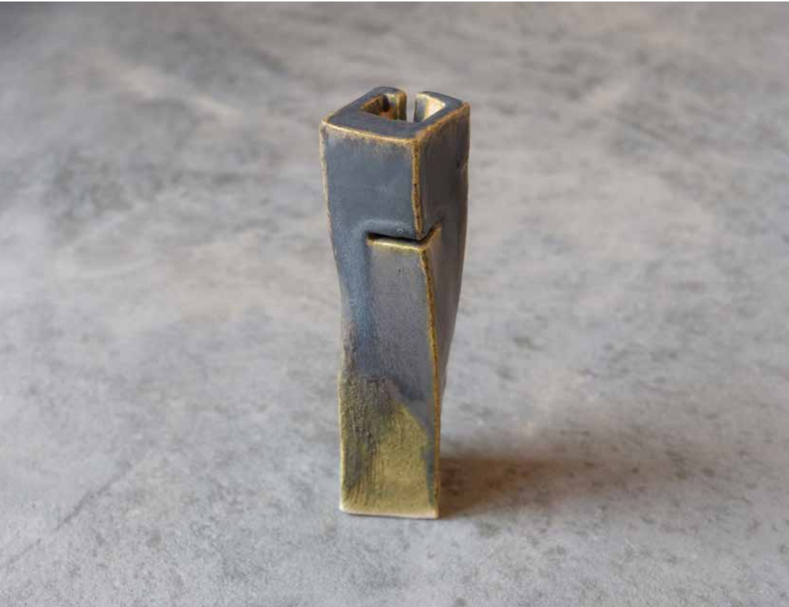
SCULPTURAL VASE 'DARK GREEN' | CLAY | CERÁMICA | 19x6x5 cm