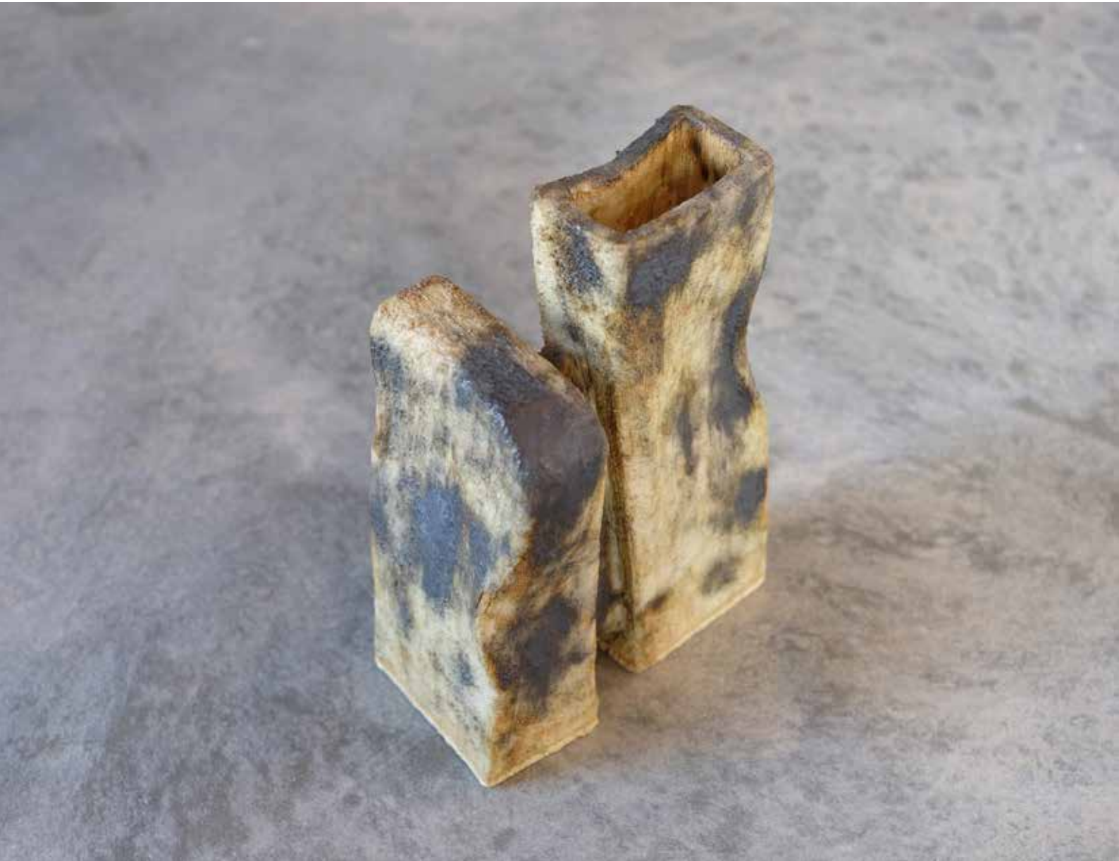
SCULPTURAL VASE 'H' | CLAY | CERÁMICA | 19x9x14 cm